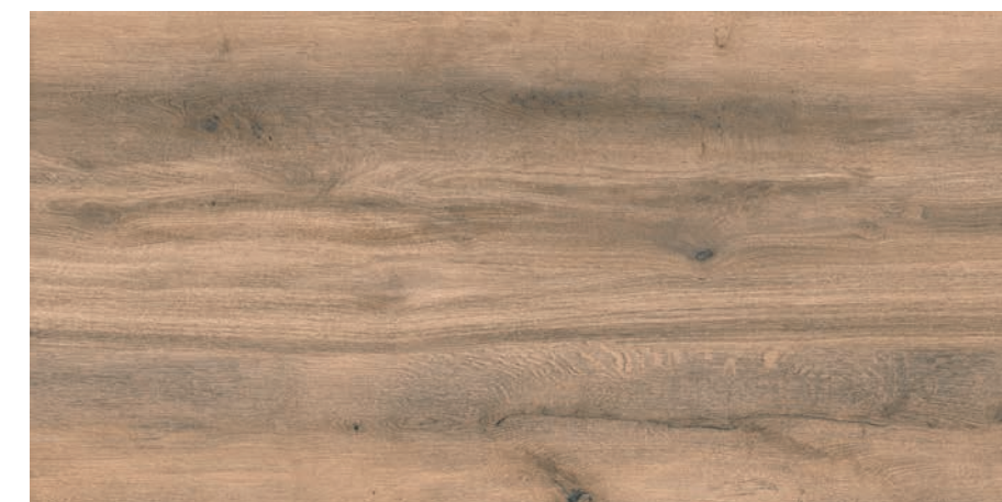
MAYARI TITANIUM 60X120