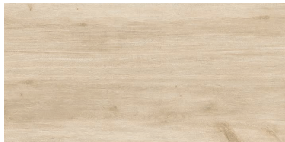
MAYARI CREMA 60X120