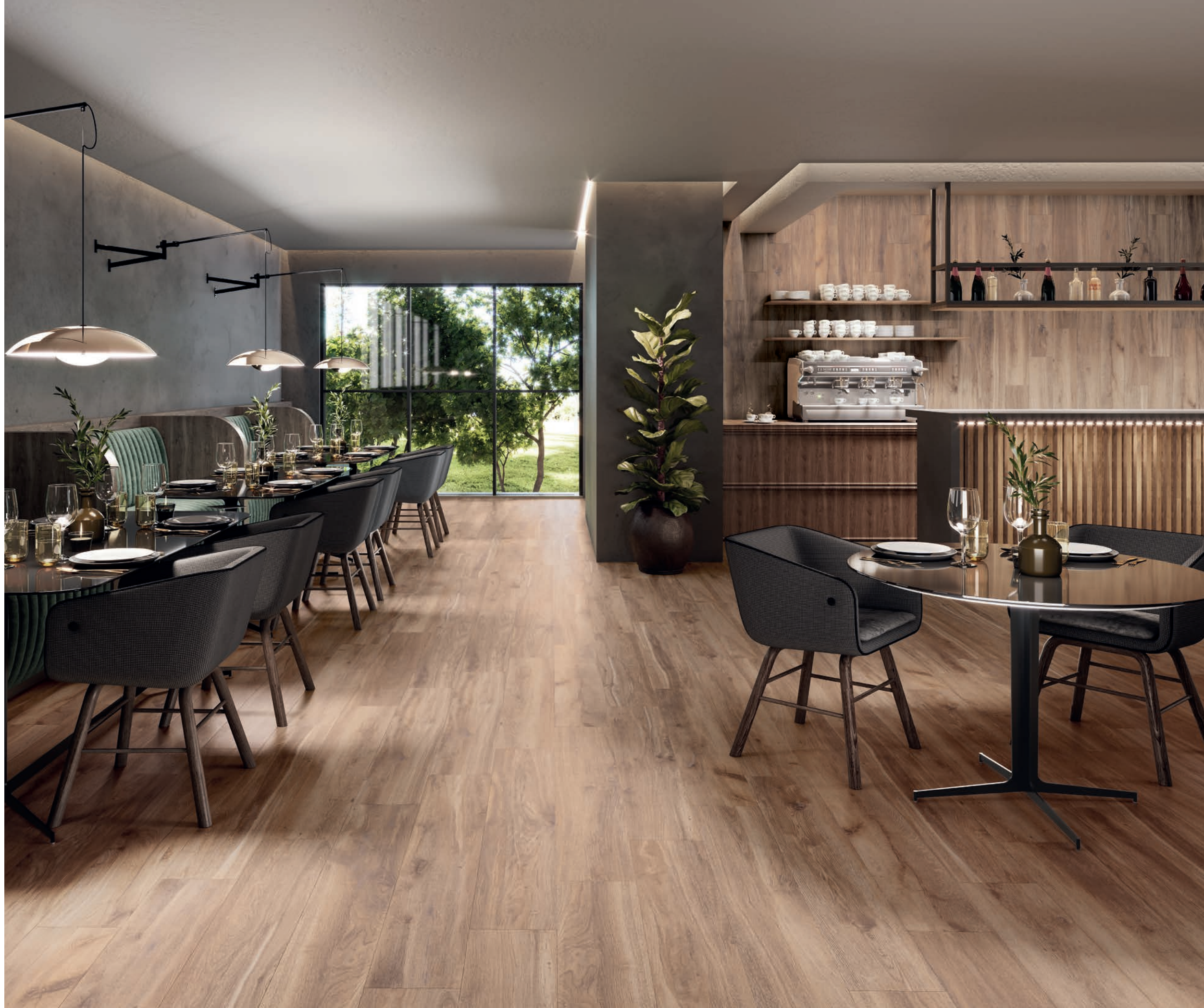
WALL TILES: MAYARI ROBLE 20X120 FLOOR TILES: MAYARI ROBLE 20X120