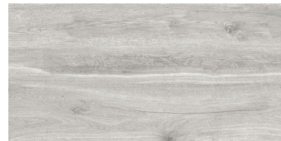
MAYARI GRIS 60X120