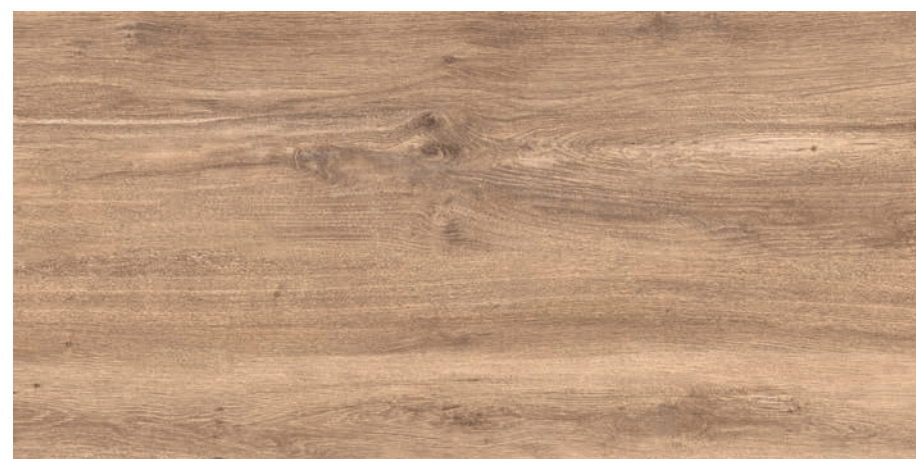
MAYARI ROBLE 60X120